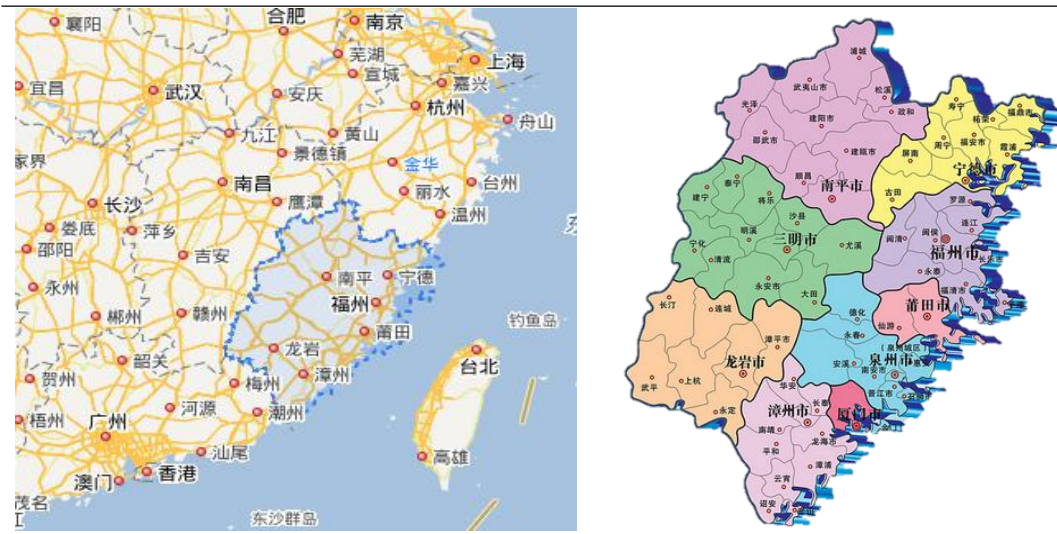
图表 2 福建省区位图